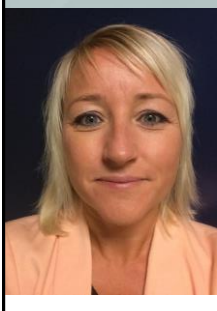
Industri tekniker Talentspor